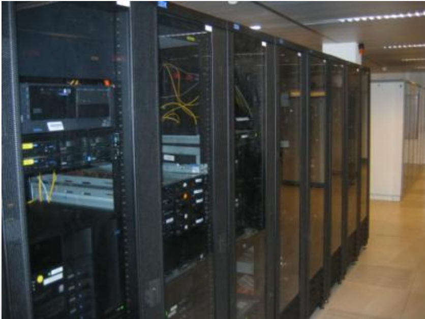
Imagen similar a la original